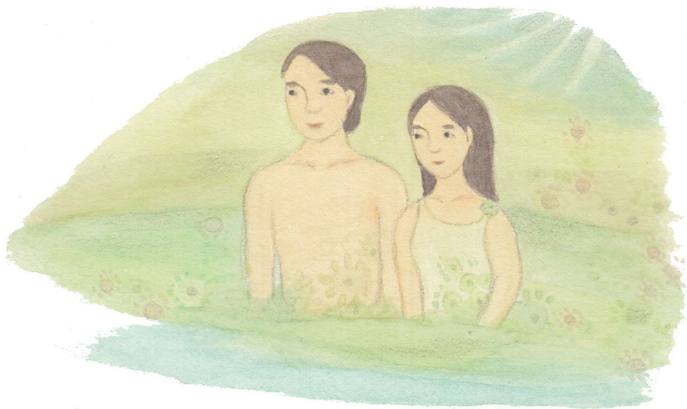
그림 · 이재림 비비아나

하느님께서는 우리를 남자와 여자로 만드셨습니다. 바로 성(性)을 선물로 주신 것이죠. 창세기에는 최초의 사람 이었던 아담이 하와를 만났을 때가 나옵니다. 그때 아담이 어떤 말을 했는지 아시나요? “내 뼈에서 나온 뼈요. 내 살에서 나온 살이로구나!”(창세 2, 23) 아담은 하와를 보고 너무나 기뻐서 환호성을 질렀습니다. 이것이 바로 인류 최초의 찬미가입니다. 아담과 하와는 알몸인데도 부끄러운 줄 몰랐습니다. 순수한 마음으로 서로를 바라본 것이지요. 이것을 원순수의 상태라고 합니다. 이때의 순수한 사랑을 기억하고 그 모습으로 살아가는 것이 진정한 행복입니다.